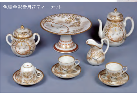
色絵金彩雪月花ティーセット