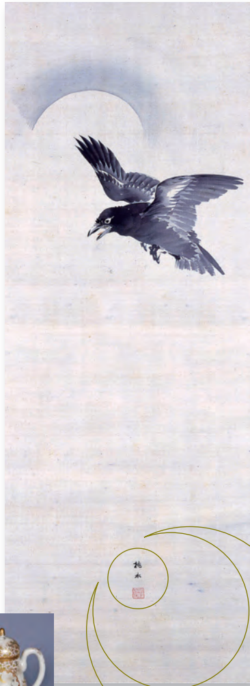
月下飛鳥図(前期展示)