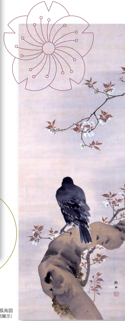
桜花孤鳥図(前期展示)