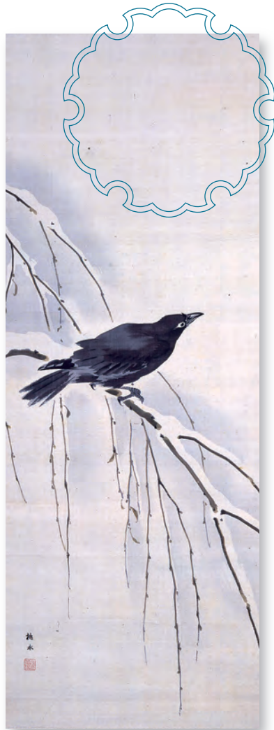
雪柳孤鳥図(前期展示)

古代から、冬は雪・秋は月・春は花が、その季節を代表する景物として考えられ、美術品にも雪月花を題材とした物が多く残されています。掛軸・錦絵・漆器・陶器といった様々な作品の中から季節の楽しみ方を見つけてみませんか。